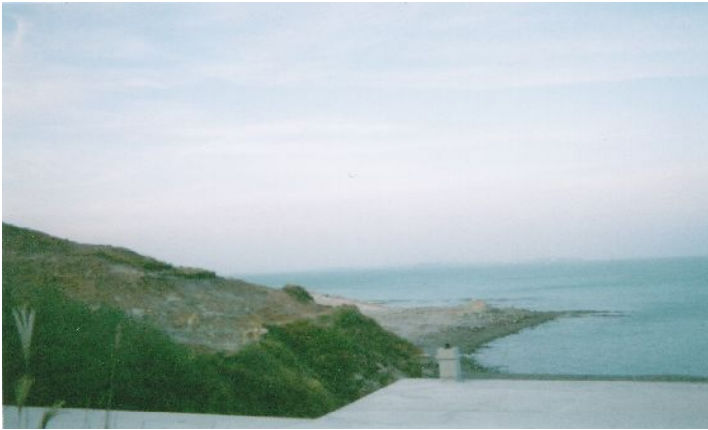
葫芦島の海

1945年8月9日のソ連軍侵攻から避難生活は、はや1年が経とうとしていました。乗船前に収容された錦州収容所では検疫が特に厳しくなっていました。保菌者が出れば、その集団は何日も残されました。錦州収容所は、日本の軍営の厩でした。この収容所ではコレラが蔓延し多くの死者が出ました。